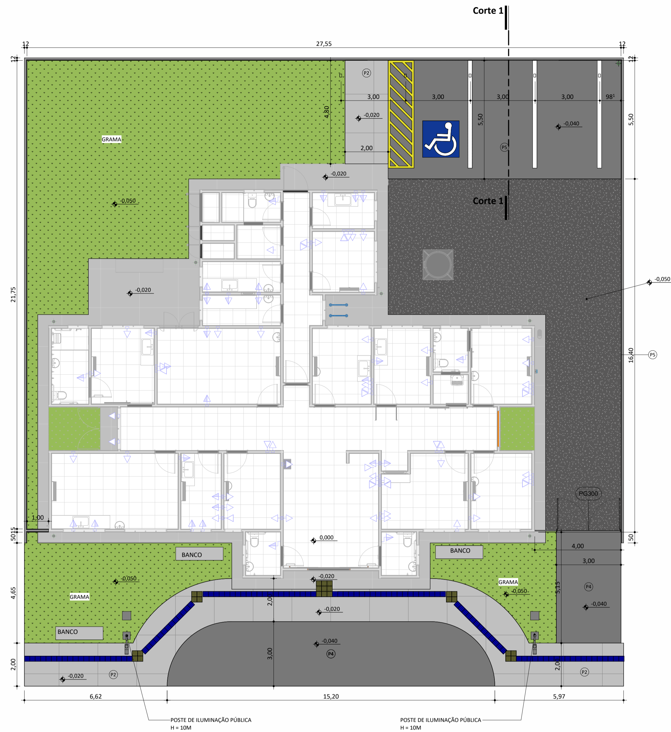
PLANTA BAIXA ESC: 1 : 100