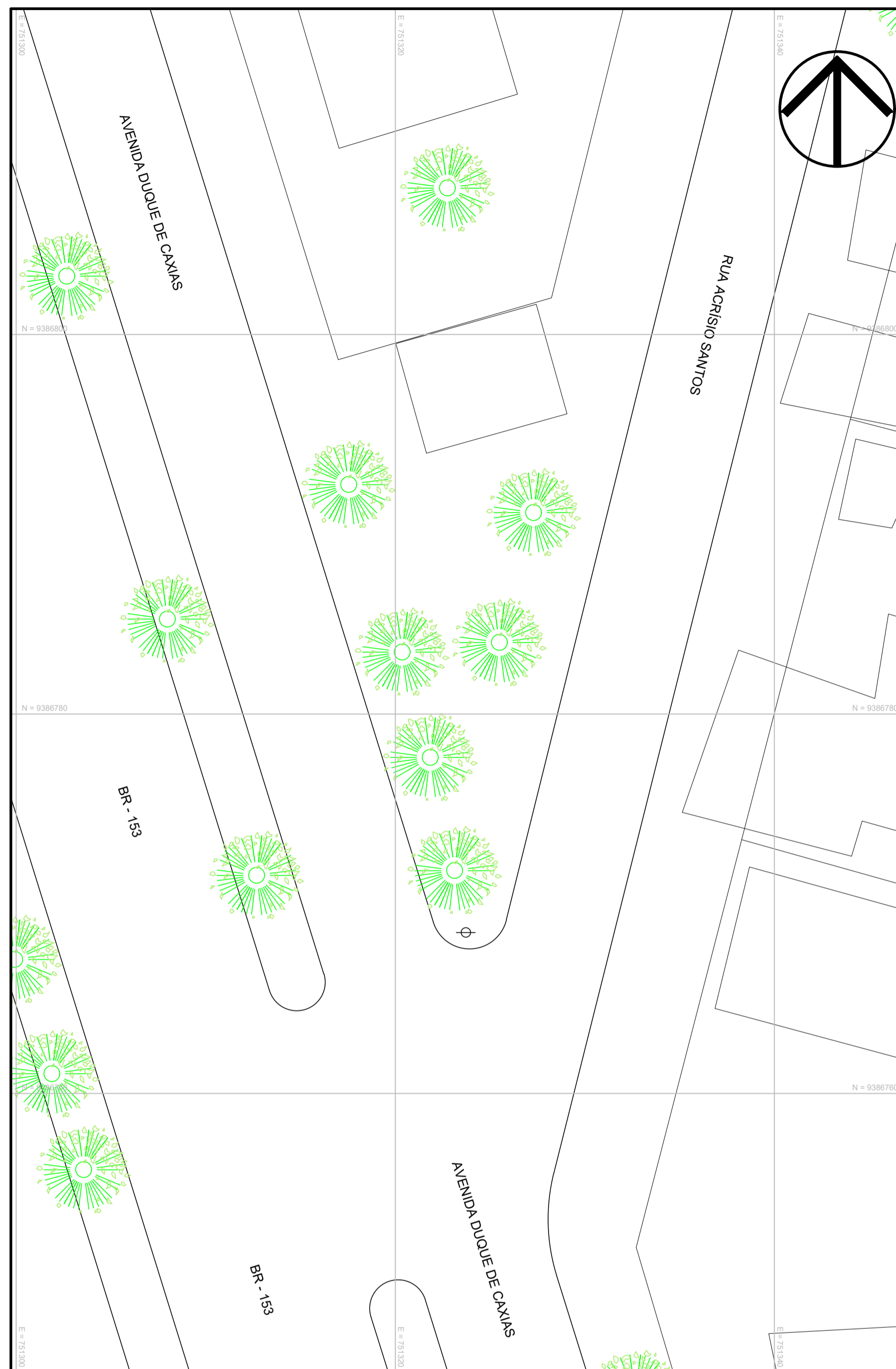
TOPOGRAFIA LOCAL COORDENADAS UTM - SIRGAS 2000 - 22S