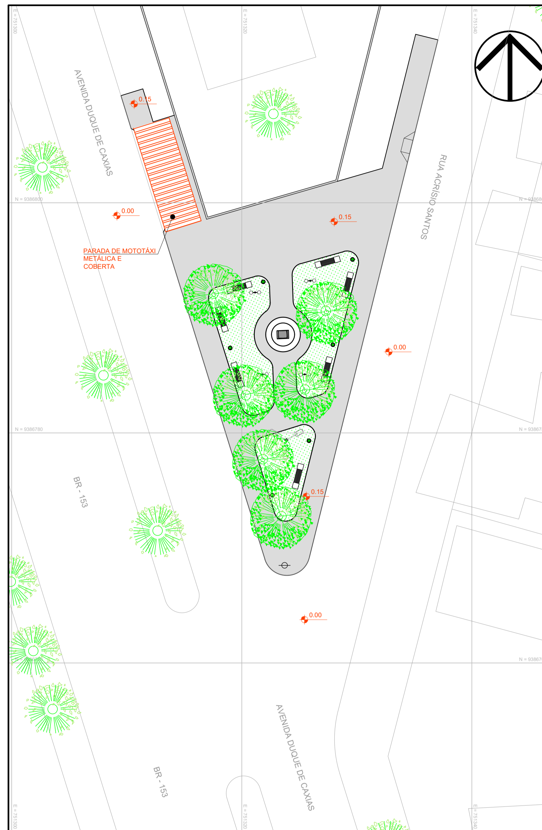
IMPLANTAÇÃO TOPOGRÁFICA ÁREA DE IMPLANTAÇÃO = 460,00 m²